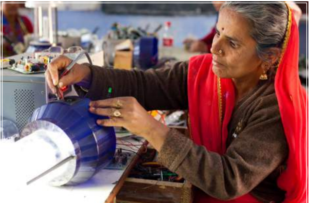
India: formazione tenuta da un'esperta in ingegneria solare.