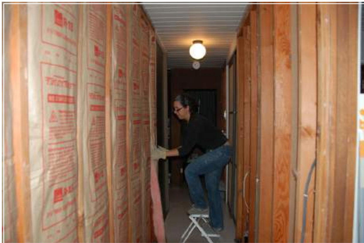
Installazione di pannelli isolanti domestici.

Nonostante questo studio si concentri unicamente sul Regno Unito (gran parte della ricerca riguardante la comunicazione sul cambiamento climatico viene condotta in Gran Bretagna o negli USA), esso fornisce un buon punto di partenza per affrontare il dibattito sul cambiamento climatico.