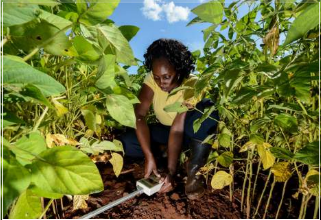
Test sullo stato di salute del suolo in Kenya.

Presentare le informazioni sotto forma di racconto permette di creare un legame più sostenibile e significativo con la scienza perché le persone comuni sono molto più abituate a scambiarsi informazioni attraverso storie che non tramite grafici e numeri. 52 L'uso del racconto nella comunicazione scientifica è sempre più diffuso: 53 la forma narrativa non solo aiuta il pubblico a capire concetti complessi e astratti, 54 ma li rende anche più facili da ricordare e da elaborare rispetto alle forme tradizionali di comunicazione della scienza, come elenchi di dati, grafici e figure. 55 Comunicare la scienza sotto forma di racconto è ancor più efficace quando si usa un linguaggio che rifletta le preoccupazioni degli ascoltatori.