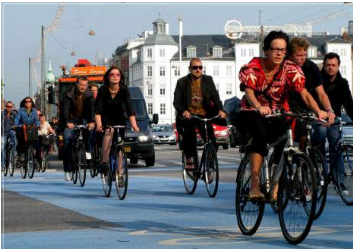
Traffico dell'ora di punta a Copenaghen, Danimarca.

Equilibrio. Il tema dell’equilibrio colpisce particolarmente la sensibilità del pubblico di centro-destra. In questo contesto, equilibrio significa evitare di porsi obiettivi troppo ambiziosi e seguire piuttosto una filosofia dettata dal buon senso. 22 Con un pubblico di centro-destra o di orientamento religioso, “equilibrio” è un concetto che può essere usato in senso metaforico, in cui il cambiamento climatico è sintomo di quanto il mondo si trovi in uno stato di disarmonia e malessere. 23,24