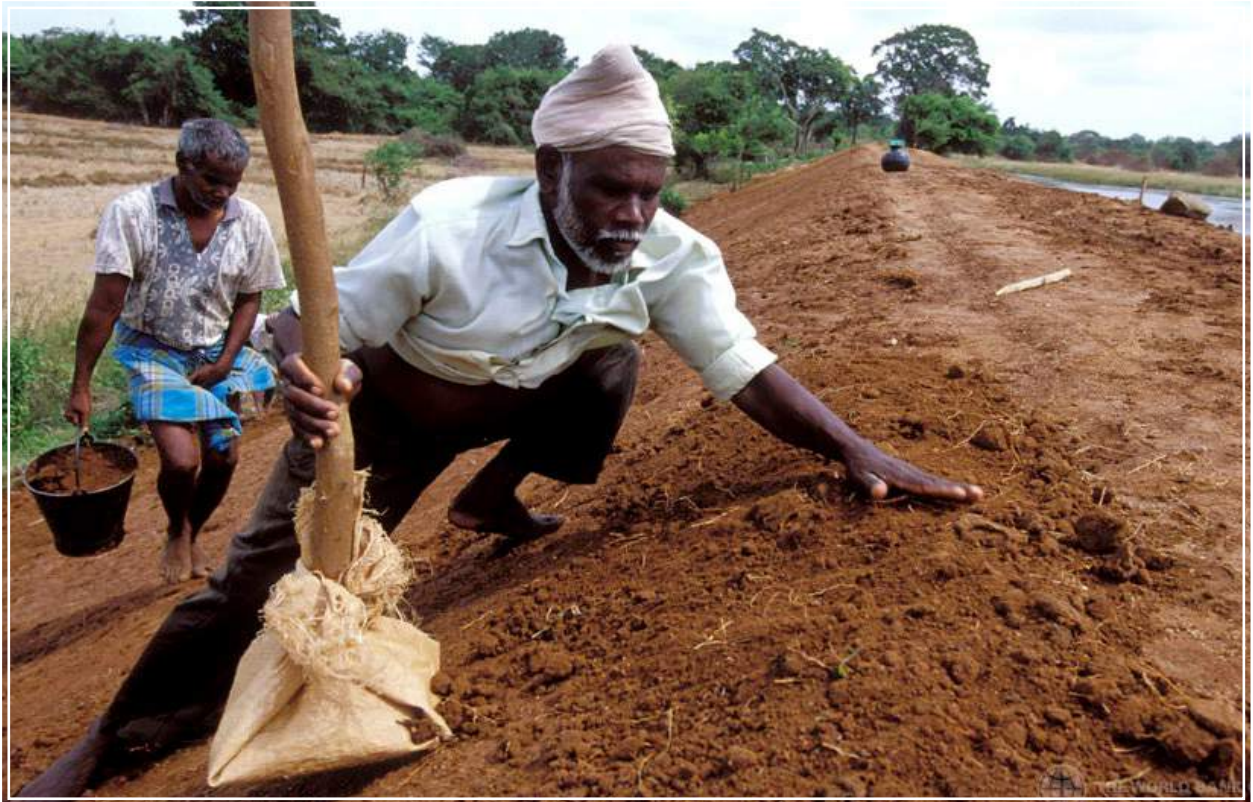
In Sri Lanka, due uomini riparano un argine in cui si è aperta una breccia.