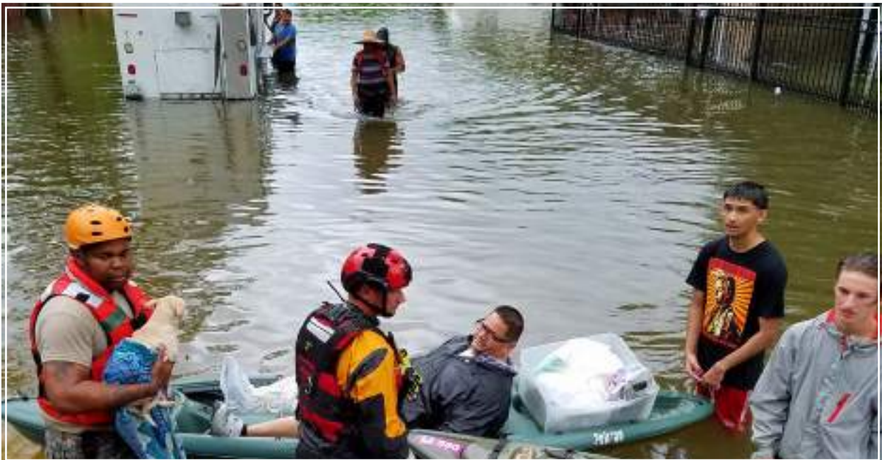
I militari della Guardia Nazionale del Texas soccorrono le vittime dell'uragano Harvey negli USA.