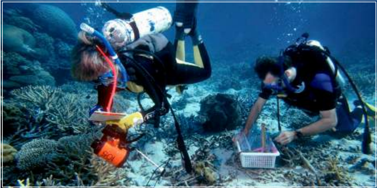
Biologi marini prelevano campioni dalla Grande Barriera Corallina australiana.